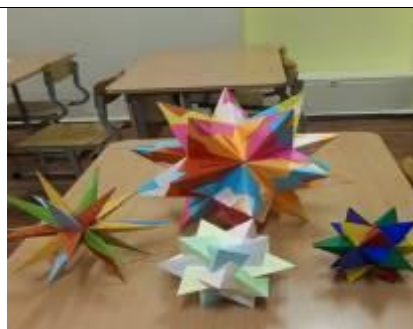
модели правильных многогранников, созданные своими руками (10-е классы).