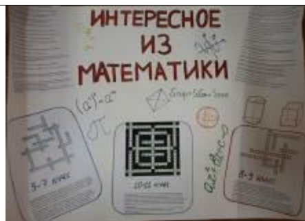
стенгазеты, выполненные учащимися 9 и 11 классов

Математика – царица наук! Для успешного овладения учебным материалом большое значение имеет заинтересованность учащихся. Некоторым вполне достаточно радости, получаемой от решения задачи, примера, чтобы появился интерес к математике. Но есть ученики, у которых вызвать интерес к предмету можно лишь, только с помощью дополнительной работы. Проведение предметных недель в нашей школе стало традицией. В этом году неделя математики в школе проходила с 3-8 декабря 2018 года. В предметной неделе приняли участие все учителя математики, а также учащиеся 5-11 классов.