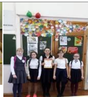
команда «Плюс на минус» заняли 3 место!

Также в течение всей недели учителя математики и учащиеся 10-х классов готовились к проведению городского интеллектуального квеста «Приключения в математическом городе», который проходил в субботу, 8 декабря в нашей школе.