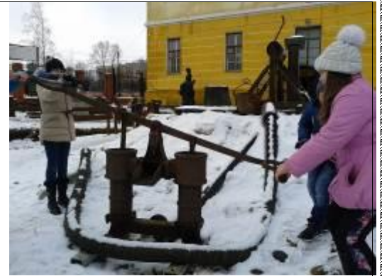
Учащиеся 5-А класса.